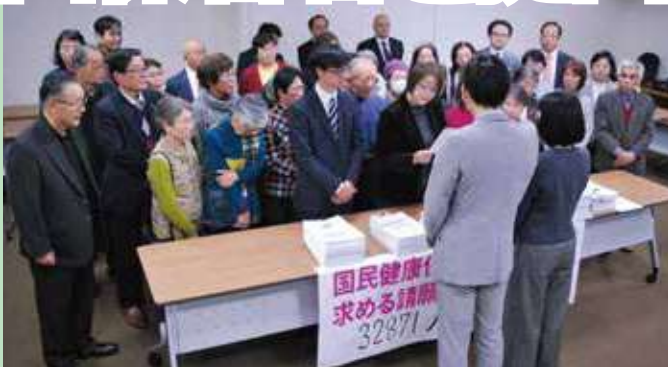
国民健康保険料引下げなどを求める署名 3万 2871 筆が市議会に提出されました (昨年 12月 17日)