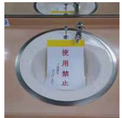
2ヶ月も壊れたまま放置されていた市民センターの手洗い