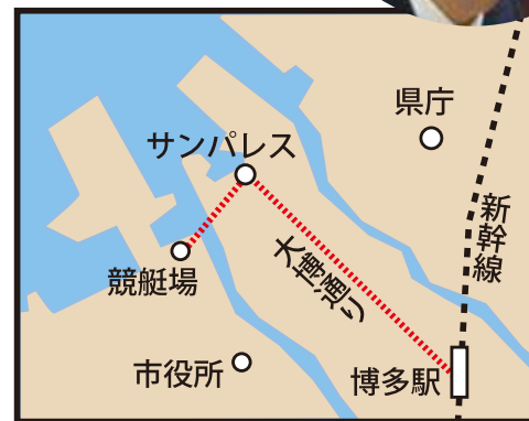
赤い点線が「新交通」の予想ルート