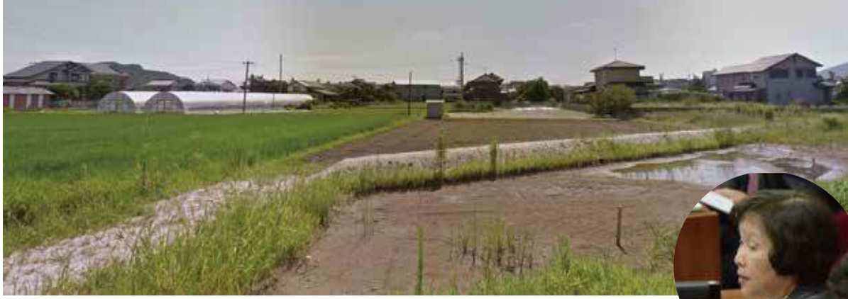
新たな開発がうちだされた九大学研都市駅の北部地域の周辺（上） 補足質疑をする熊谷市議（右、3月8日）