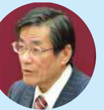
意見書への討論をするひえじま市議 (3月28日)