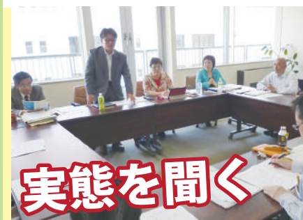
建設労働者のみなさんと懇談。実態を聞きました(5月26日)