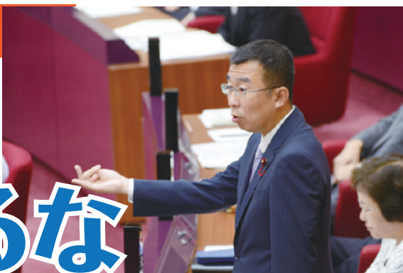
市長に迫る倉元市議 (6月24日)