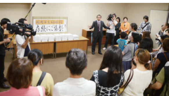
7万をこえて集まった存続署名 (2013年)