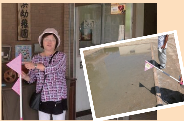
学校ウォッチングで市民の方とともに西区の幼稚園を調査する熊谷市議。右は水が引かない西区の中学校