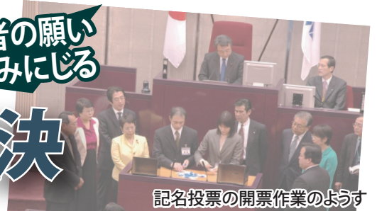
記名投票の開票作業のようす