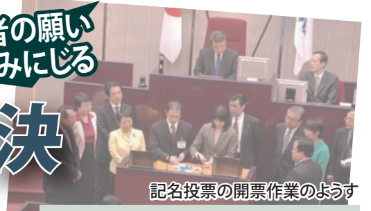
記名投票の開票作業のようす